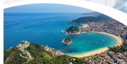
11 31 Congreso GEER