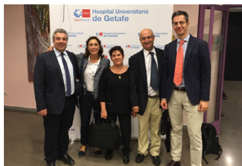
3 Curso Básico de Patología Vertebral